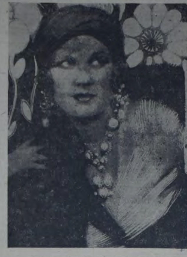
ESTHER RALSTON, PRINCIPAL INTERPRETE DE LA PELICULA "Candilejas"