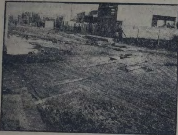
DOS NOTAS GRAFICAS DE VILLA CASTELLINO (Avelanada): PUENTE EN PESIMO ESTADO EN LA CALLE ISLETA Y CONESSA. — CALLE Chile esquina Constitución