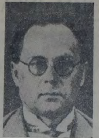
EL VICEPRESIDENTE DE LA "IUYAMORG", que formula interesantes declaraciones a LA VANGUARDIA.

entidades es similar a la del "Koyimport" y depende cada una de su respectivo sindicato. Todos los sindicatos son autónomos y están bajo la fiscalización superior del "Narkomorg", o Comisariado del comercio. La sociedad "Iuyamorg", como queda dicho, está en relaciones de negocios con todas esas entidades, así como con los bancos de la U. R. S. S.