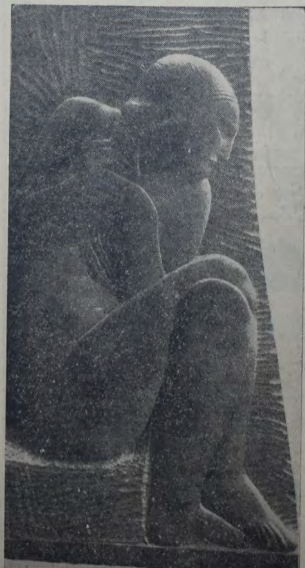
"MIRA TRENZÁNDOSE EL CABELLO". — BAJORRELIEVE EN MADEIRA que figura en la exposición de los "Amigos del Arte".

oro, y su bastón que se hizo legendario. Era un bastón particular, con un puño enorme, inmenso, en forma de masa, cincelado e incrustado de pedrerías de hueso, para contener, según decía, los cabellos de una mujer amada, que se los había enviado estando preso a causa de no haberse presentado a prestar sus servicios en la guardia nacional. Ese era el lado infantil de aquel gran hombre; la verdad era otra, menos alegre, por cierto. Los acreedores lo acosaban, y para escapar a su persecución, vivía bajo un nombre supuesto, el de la viuda Brunet. Para entrar en su casa era preciso conocer la palabra de orden, y decir al portero: "La estación de las ciruelas ha llegado" o "madame Bertrand sigue bien".