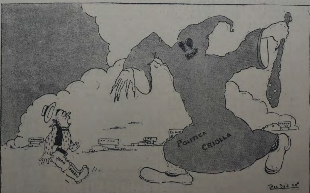
¡Este es el verdadero peligro!

fauna jurídica con el nombre de aves negras, esta liquidación ha superado en mucho a las peores acostumbradas y admitidas en la práctica de los tribunales. Y pensar que de estos procedimientos judiciales dependen los modestos haberes de 450 familias cuyos miembros han formado parte del personal de la empresa en balnearia! ¿Dónde deberán recurrir ahora los damnificados en demanda de justicia? Es, sin duda, una verdadera paradoja que los que más necesitan de verdad el apoyo de la justicia, siempre ocupados por los pleitos que mueven los que no la tienen pero que representan un cambio interesante importante que pueda pagar asesores jurídicos para no recurrir nunca la razón de los más débiles.